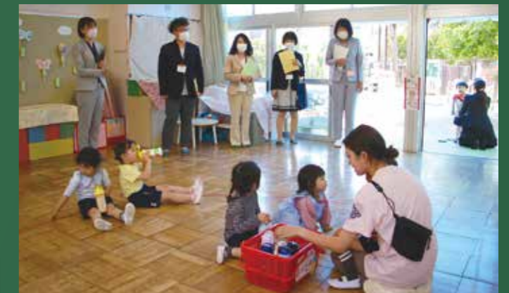
▲かみさぎ幼稚園訪問

児童・生徒との対話集会、地域での教育委員会などの活動を通し、子どもたちと触れ合い、地域のみなさんの声を生かします。